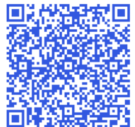
Abbildung 1 SCAN ME